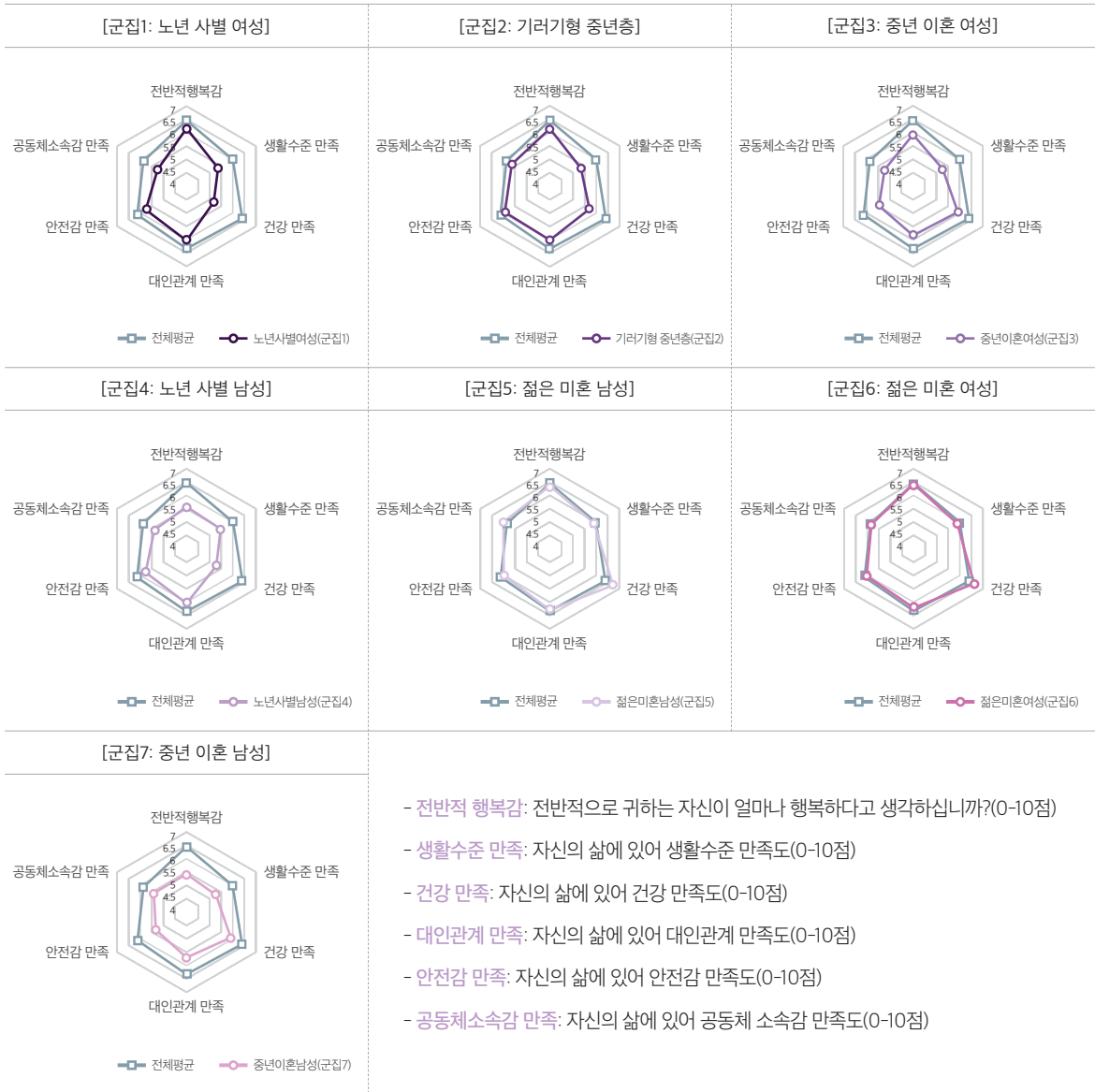
<그림 2> 1인가구 군집별 행복과 만족도 수준 비교